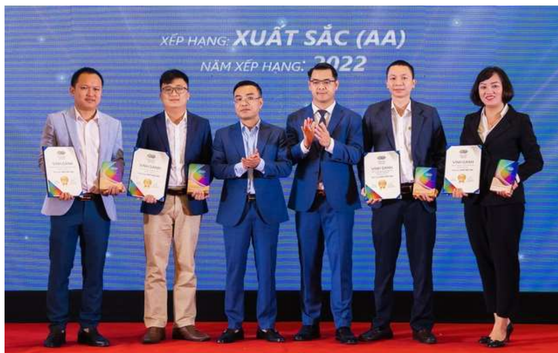
Các thành viên thị trường xếp hạng xuất sắc trong năm 2022

Ngày 18/5, tại Hà Nội, đã diễn ra một loạt các sự kiện trong chuỗi sự kiện, hội thảo của thị trường giao dịch hàng hóa Việt Nam. Các sự kiện này đã đánh dấu bước phát triển và mở rộng của thị trường sau 5 năm được liên thông giao dịch với thị trường thế giới.